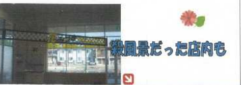
後風景だった店内も

いとく秋田東店店内へ入ってすぐ目にと まるとても明るい雰囲気のお店です。 いつも新鮮なお花がいっぱい！