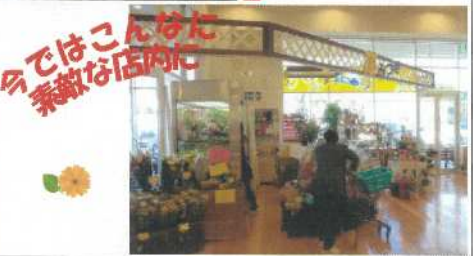
今ではこんなに 素敵な店内に