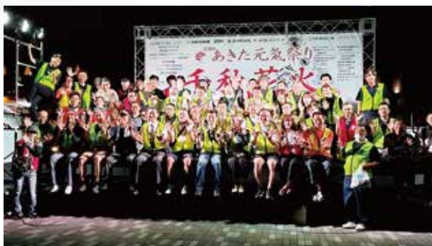
最後は記念撮影 お疲れさまでした

第九回千秋花火 桟敷席ご招待券プレゼント企画にはたくさんご応募いただき誠にありがとうございました。抽選は応募者が多く予定数を大幅に増やして行いました。当選者にはチケットをプレゼントさせていただきました。当選のお客様、ゆっくり楽しんでいただけましたでしょうか?今回惜しくも選ばれなかった皆様や応募されなかった皆様、来年は10回目の記念の年となります。是非ご応募ください。お待ちしております。