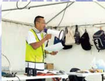
これから会場設営です。

今年で第九回目のあきた元気祭りin千秋花火は7月の水害による「復興」の意味を込めて「頑張ろう、秋田!～希望の花を咲かせよう～」をテーマに午後6時からスタート!