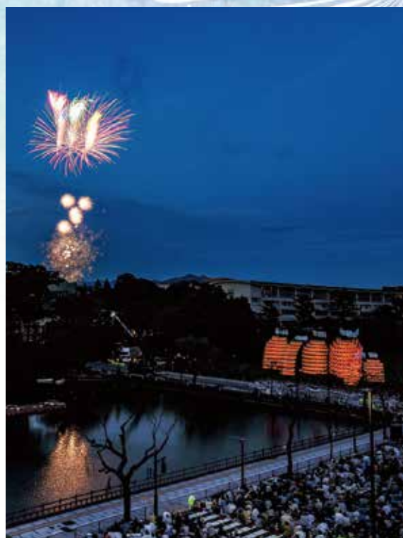
花火と竿燈のコラボ 素晴らしい!