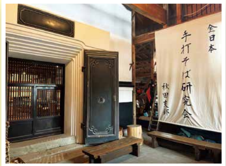
厨房と店内の一部内装をお手伝い!

宮城県大崎市岩出山の名店 純手打ちそばもみじ野で修行したそうです。お店の雰囲気は古民家と蔵のある店舗で贅沢な時間を過ごしてみたいかがでしょうか。