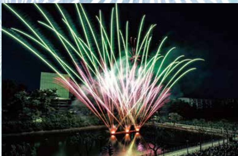
元気でる応援ソングメドレーでの花火演出で観客の皆様の拍手!拍手!