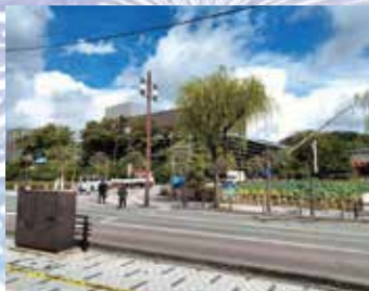
お堀には仕掛け花火の準備が進められています